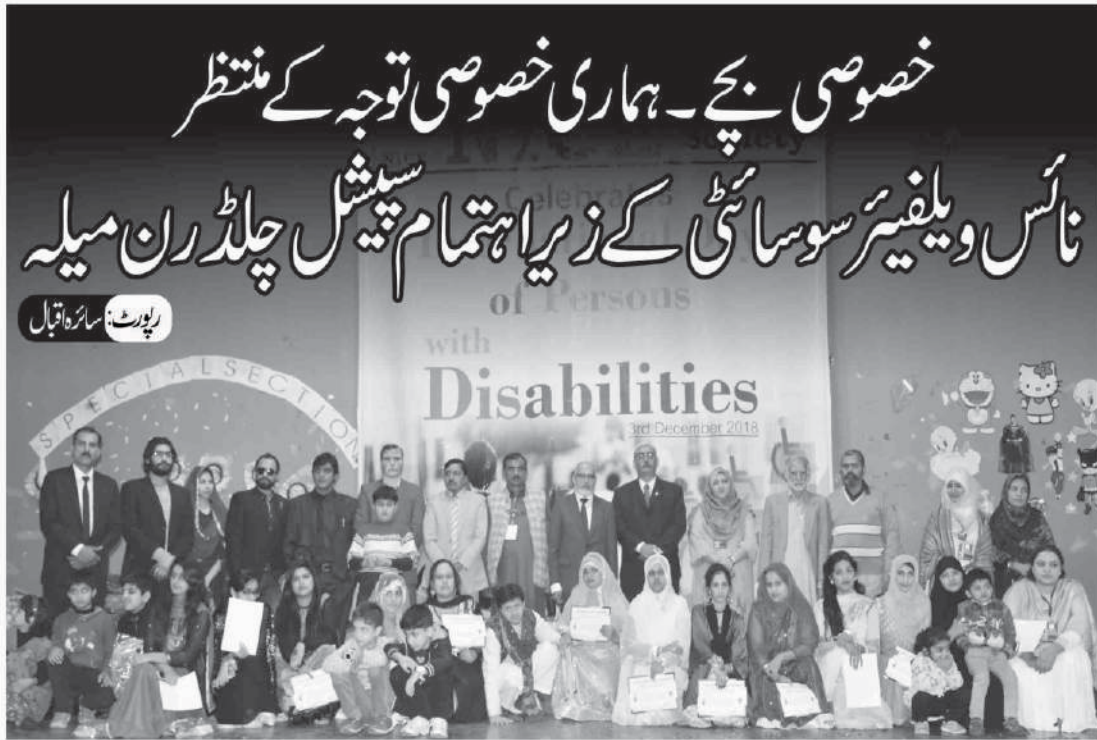
رپورٹ: سائرہ اقبال