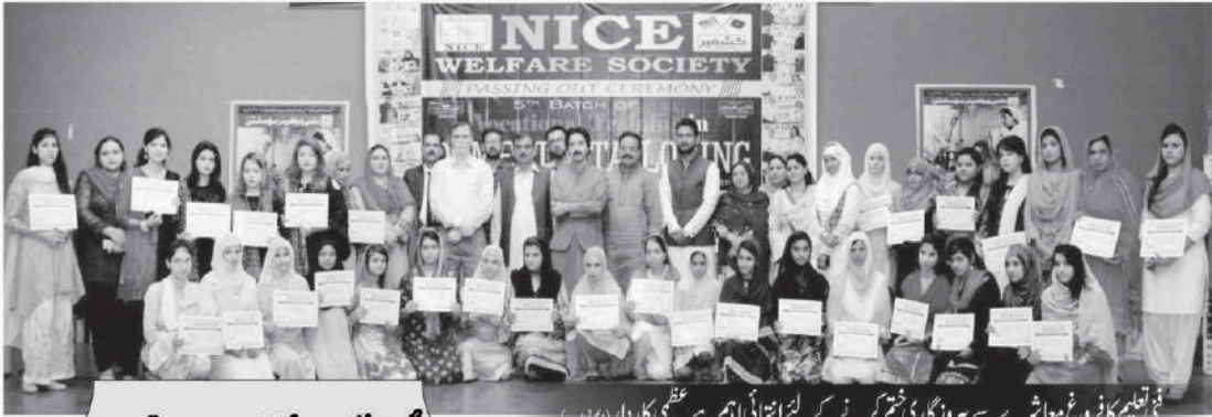
فنی تعلیم کا فروغ معاشرے سے بیروزگاری ختم کرنے کے لئے انتہائی اہم ہے۔ عظمیٰ کاردار (بہنیں)